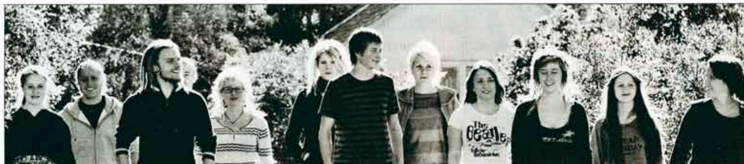
MITTFOLK. Folkmusikgruppen Mittfolk uppträder i Örtagården på lördag.