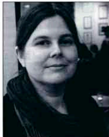
NYTT. Kompositören Britta Byström har skrivit ett nytt verk för Stöde Musikvecka.