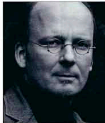
SAX. Libro Sima kommer att hålla i saxofonworkshop och framför en ny saxofonkvintett i Stöde kyrka på onsdag.